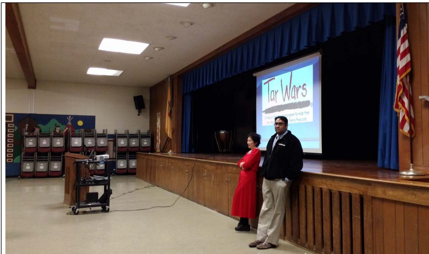
(參加 Tar Wars 健康宣導講座，到當地小學準備演講)