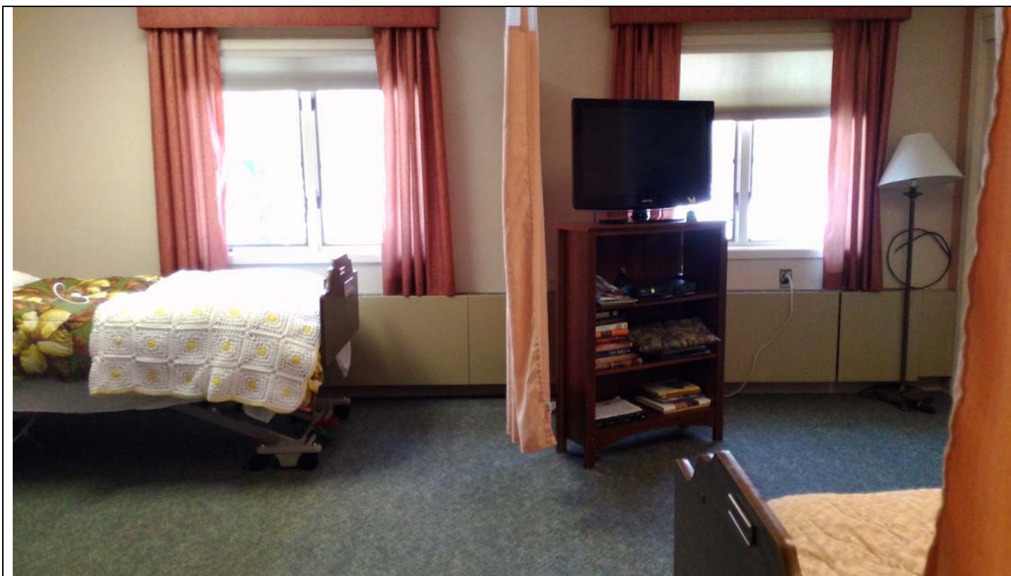
(老人長照中心的設計，提供病人足夠的隱私)