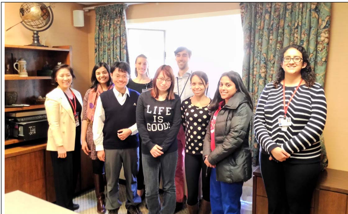
(在醫院的最後一天，像科內成員們報告完我們一個月所見所聞，並與住院醫師們合照)