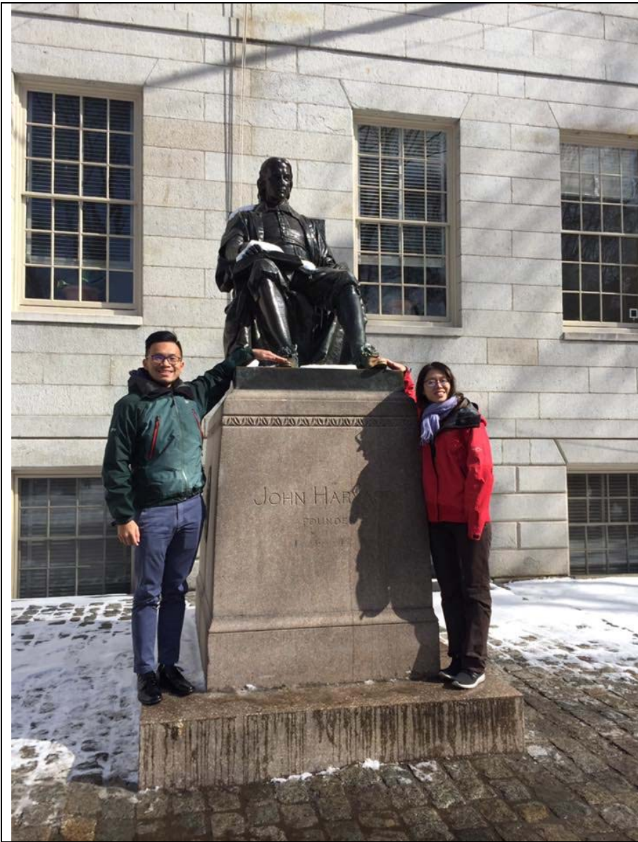
上圖：哈佛校園裡的 JOHN HARVARD 雕像，據說摸他的腳會學業進步！