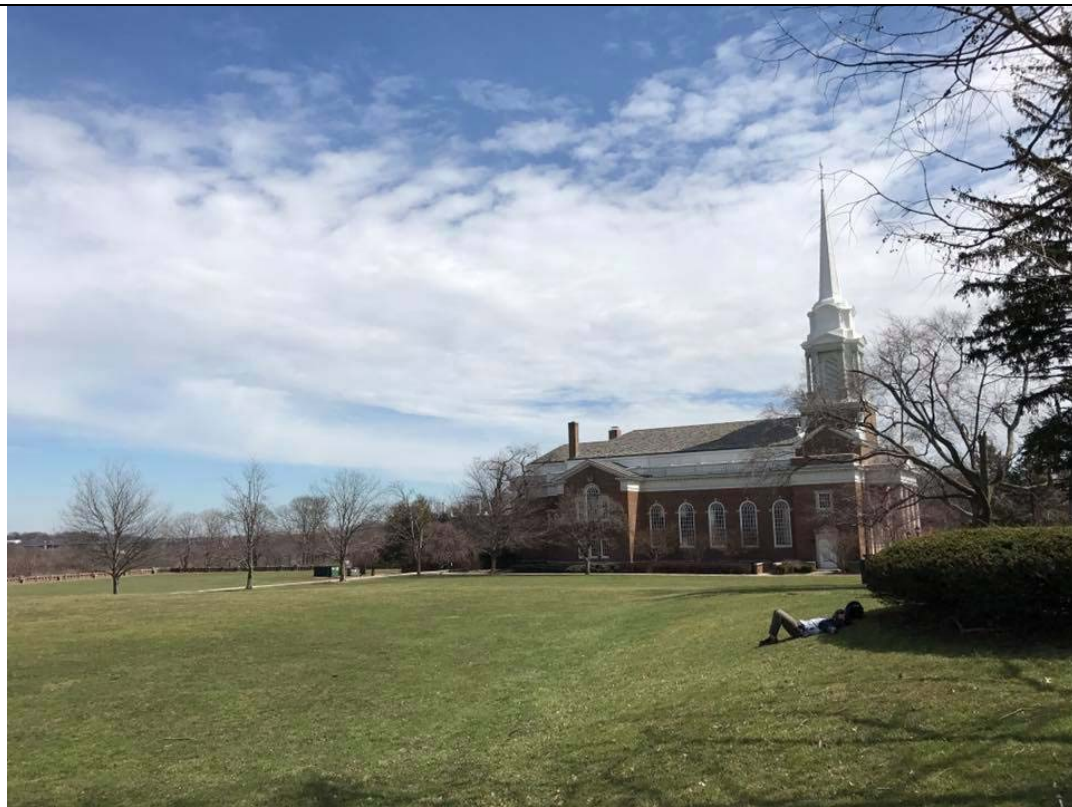
上圖: Rutgers 校園一景. Rutgers 校園分成很多 campus. 這個是 Douglas campus