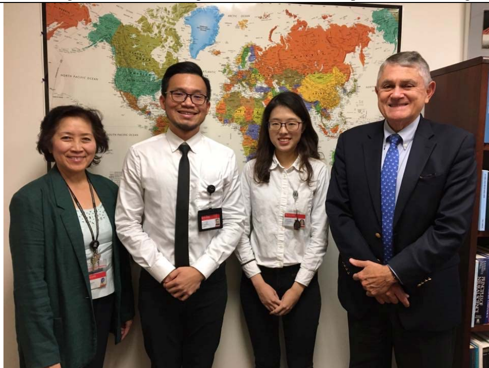
上圖: 和 global health 的指導醫師和主任合影