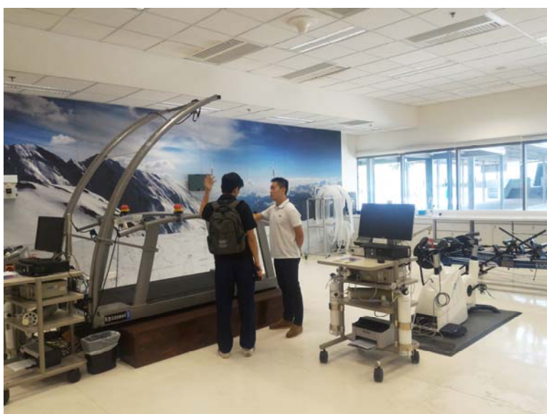
新加坡國家運動中心的儀器設施，協助評估運動員的運動狀況。