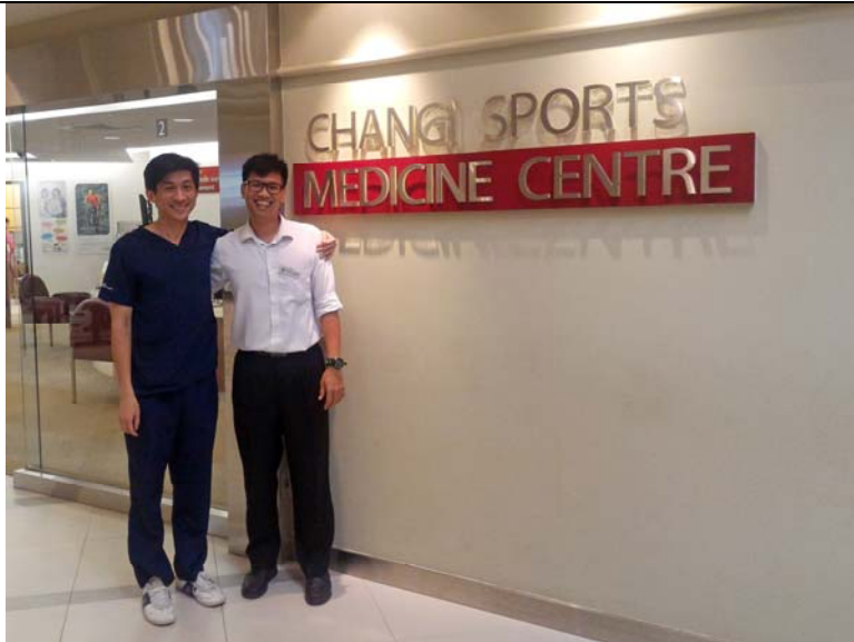
樟宜醫院的運動醫學部。跟指導老師的合影。