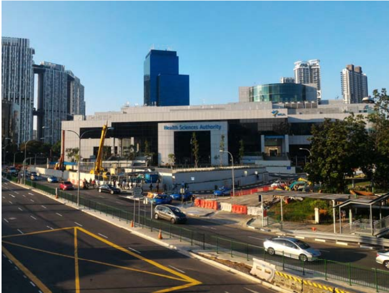
Health Sciences Authority 的辦公室。