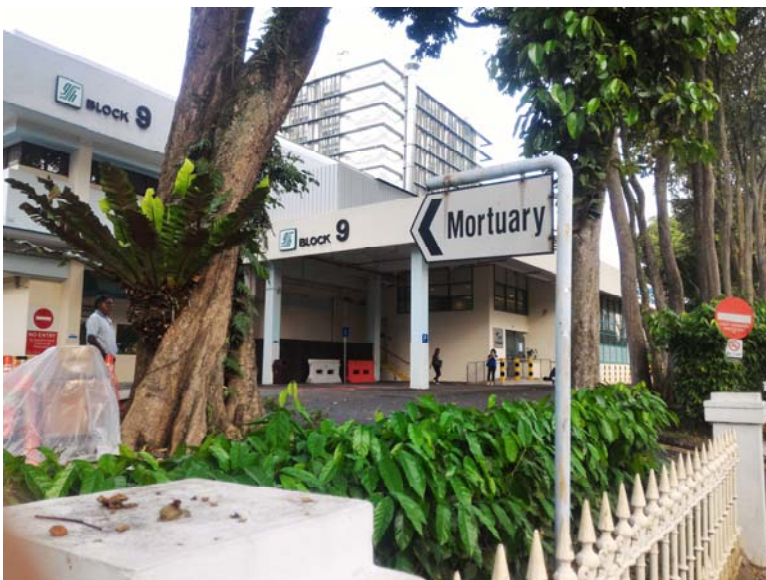
全新加坡非正常死亡或不明原因死亡的人都會送到 HSA 的停屍間去進行解剖。